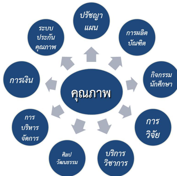
ภาพที่ 3 องค์ประกอบของการประกันคุณภาพการศึกษา

ปัจจุบันสถาบันบัณฑิตพัฒนบริหารศาสตร์ได้ดำเนินการตามคู่มือการประกันคุณภาพการศึกษาภายในสถานศึกษา ระดับอุดมศึกษา พ.ศ. 2553 ซึ่งมีองค์ประกอบคุณภาพ ตัวบ่งชี้ และเกณฑ์การประเมินทั้งหมด 9 องค์ประกอบ ดังนี้